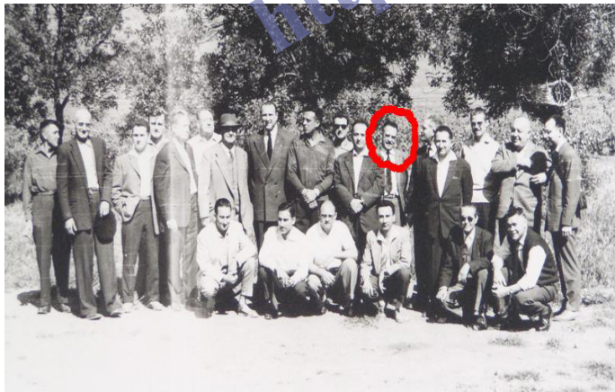
Le Groupe des Om d'Oran en 1952

F8DD: Non, ils sont presque tous décédés et un trop grand âge est un handicap pour ceux qui sont toujours de ce monde.