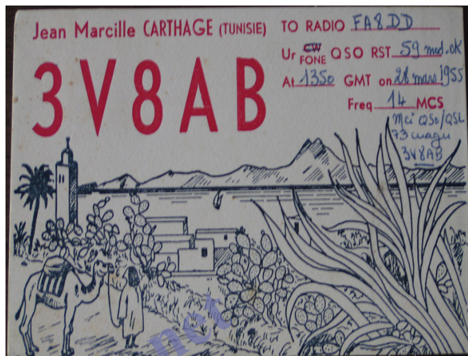
Qsl de 1955

Modulation plaque écran réalisée à l'aide d'un ampli BF acheté d'occasion.